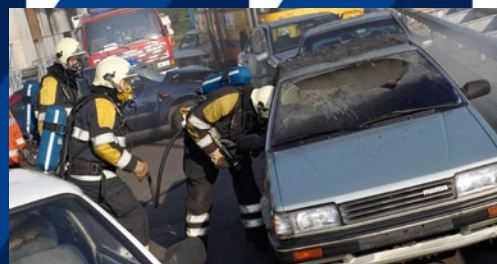
Folgeschäden bleiben begrenzt